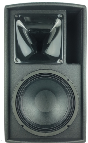
Une fois la grille retirée, le large pavillon PS utilisé avec le haut-parleur d'aigus est visible sur la photo ci-dessus.

La réponse en phase de l'enceinte ePS10 est la réponse signature de NEXO, permettant une compatibilité avec toutes les autres enceintes NEXO (sauf les configurations de retour de scène dont la latence est réduite).