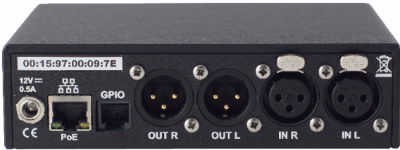
Entrées et sorties analogique

Minimal, léger et compact (Format 1/3 de 19"), \mu Scoop trouvera idéalement sa place dans des infrastructures légères nécessitant d'établir des transmissions IP de qualité professionnelle.