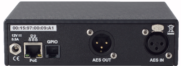
Entrées et sorties numériques